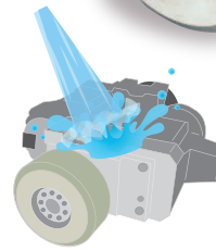
水洗いしたいときに