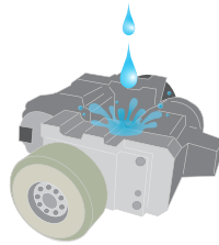
水がかかる用途に